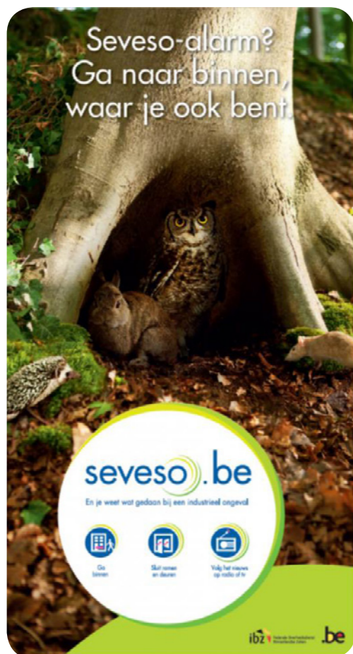
Brochure Seveso 2012

Een nieuwe stap in die richting is verwezenlijkt met het ministerieel besluit van 8 november 2012 : elke betrokken burger kan voortaan een ontwerp van noodplan dat opgesteld is door een provinciegouverneur voor een Seveso-site raadplegen en zijn opmerkingen en advies geven. In 2012 heeft het Crisiscentrum 17 provinciale Seveso-noodplannen geanalyseerd.