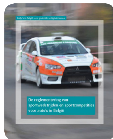
Brochure Rally 2012

gerichte brochure die in juni 2012 verspreid werd, wil de Rallycommissie openbare en private actoren helpen om samen de best mogelijke preventieve voorzieningen op te zetten. Die brochure bevat aanbevelingen, zoals: • veralgemening van een zone van 10 meter aan weerskanten van de weg die verboden is voor het publiek; • omkadering door opgeleid en voldoende kwaliteitsvol personeel; • verhoogde sensibilisering van het publiek voor de gevaren die eigen zijn aan rally's.