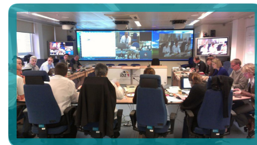
Pégase 2012, leerrijke oefening voor de nucleaire veiligheid

Een wetenschappelijk comité dat in 2012 is opgericht, brengt specifieke kennis en benaderingen van het