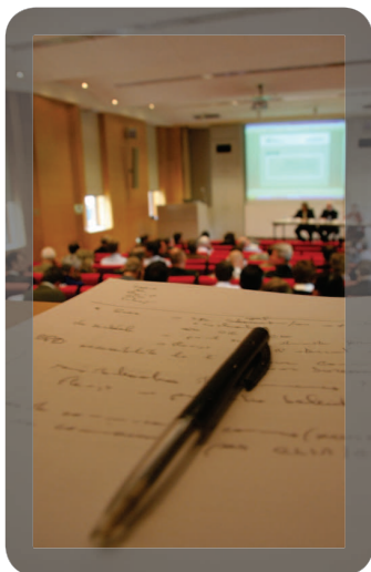
In 2011 zijn lessen getrokken voor toekomstige noodsituaties.

Op 6 juni 2011 heeft het HIN voor de provinciale veiligheidscellen een studiedag georganiseerd over de gasontploffing van 27 januari 2010 in Luik. Er is onder meer besloten dat wederzijds respect en vertrouwen essentieel zijn voor een geslaagd crisisbeheer!