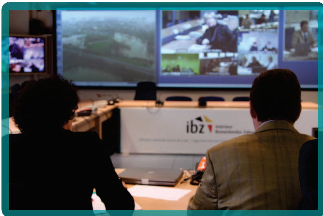
Overstromingen begin 2011: de minister van Binnenlandse Zaken en de directeur-generaal van het Crisiscentrum in videoconferentie met de gouverneurs.

Op 18 augustus 2011 heeft een zware storm het land getroffen, waardoor er op het Pukkelpop-festival 5 doden zijn gevallen en er ook veel materiële schade was. Het Crisiscentrum onderzoekt in overleg met het KMI hoe kortetermijnwaarschuwingen met een sterk regionaal karakter zo efficiënt mogelijk gecommuniceerd kunnen worden. Zo kan nauwkeuriger rekening worden gehouden met gerichte weersvoorspellingen.